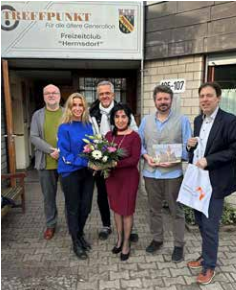
1000. Kunde im Mobilem Bürgeramt Hermsdorf

Die Überraschung ist groß, die Freude auch! Bezirksbürgermeisterin Emine Demirbükten-Wegner begrüßt im Senioren-