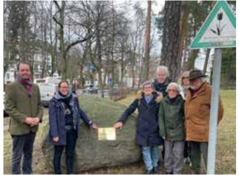
Das Eck hat nun einen Namen.

„Die Freude, dass die Fläche nun wieder einen passenden und an früher erinnernden Namen hat, wurde in den zahlreichen Gesprächen mit Bürgerinnen und Bürgern heute deutlich. Ich danke dem Straßen- und Grünflächenamt für die Or-