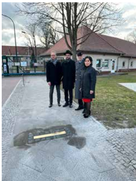
Stolperschwelle gegen das Vergessen